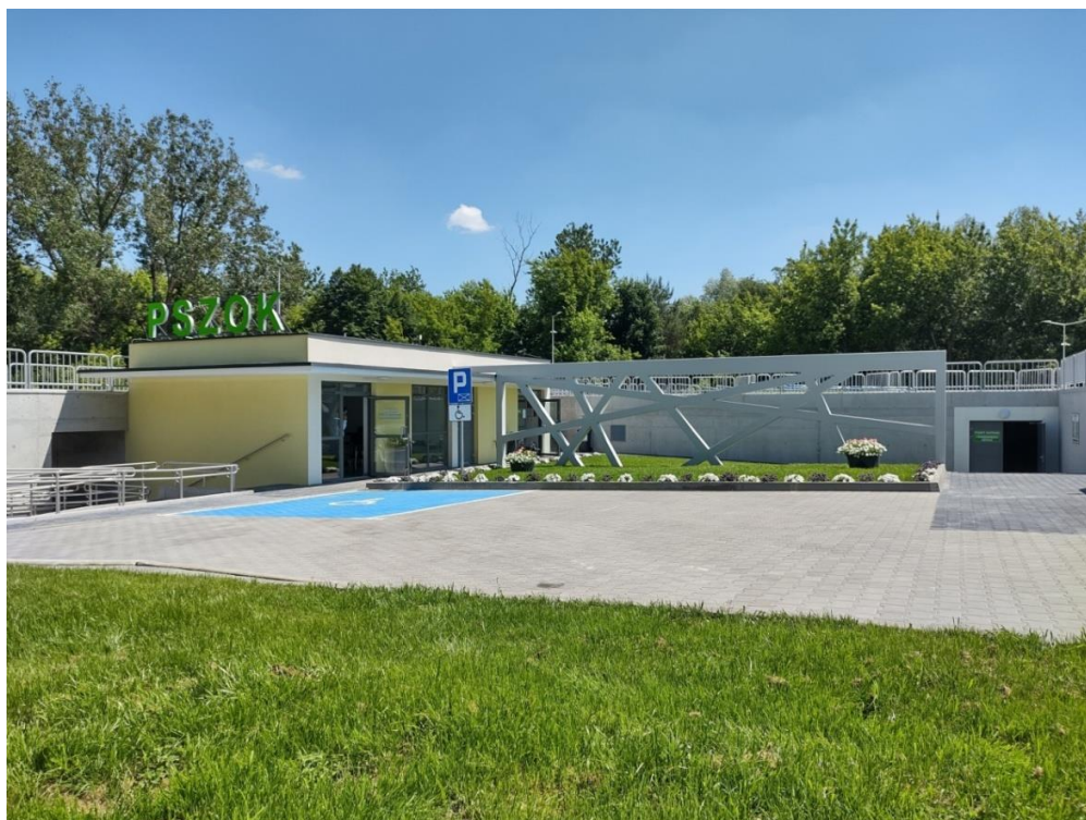
Zdjęcie nr 1. Punkt Selektywnej Zbiórki Odpadów Komunalnych

Przekazanie odpadów zebranych selektywnie przyczynia się również do zmniejszenia kosztów funkcjonowania systemu gospodarki odpadami, czyli opłat jakie ponosimy za ich odbiór.