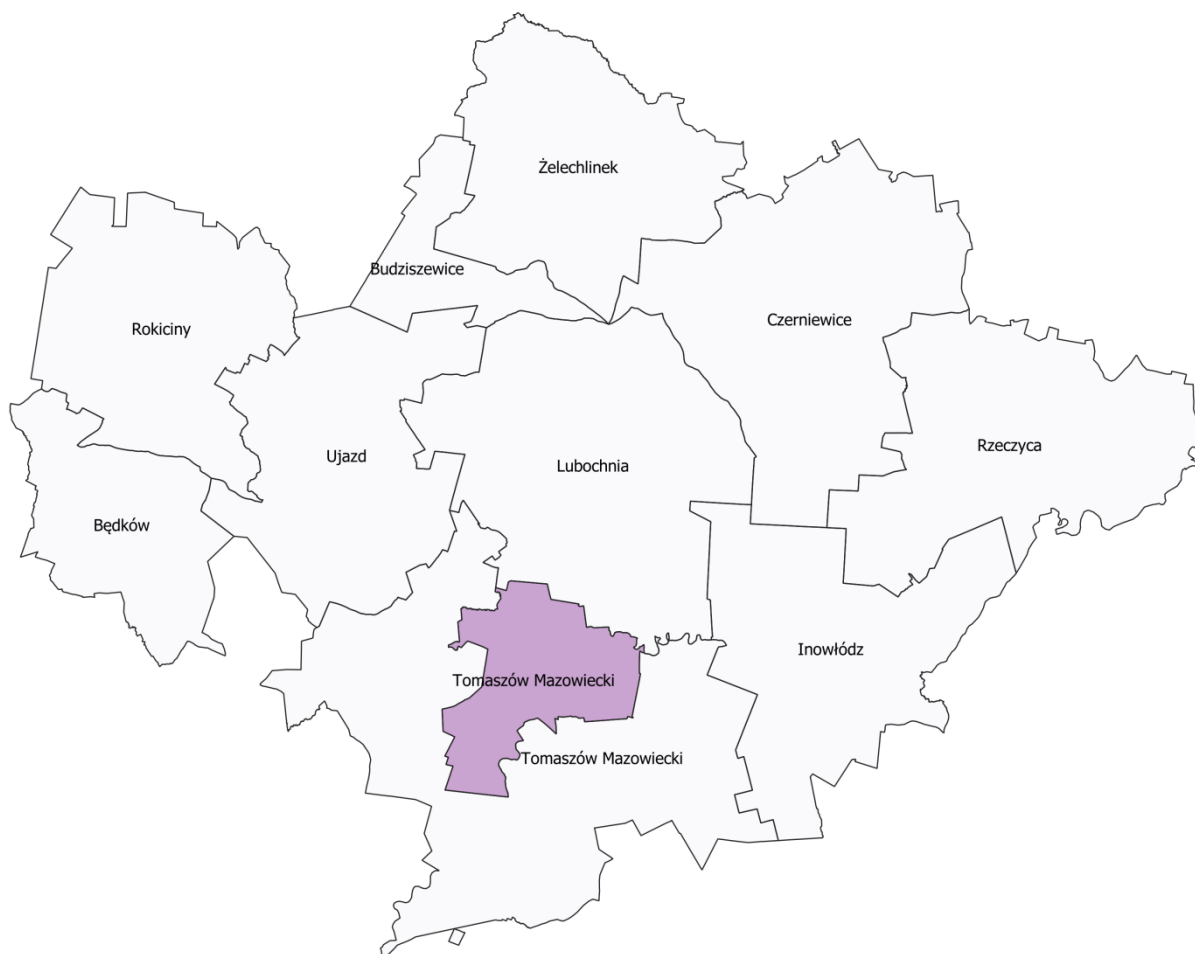
Rysunek 1. Miasto Tomaszów Mazowiecki na tle powiatu tomaszowskiego.