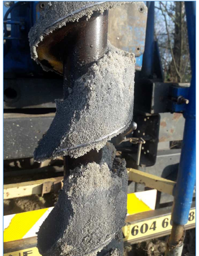
Fot. nr 8 Pobieranie próbki ze szneka