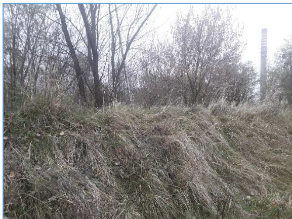
Fot. nr 3 Obwałowania składowiska