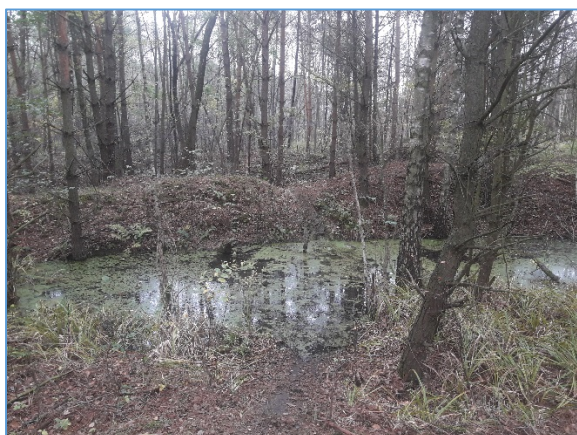
Fot. nr 5 Wyrobiska wypełnione wodą na wschód od składowiska