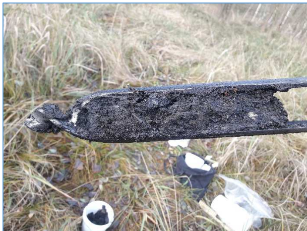
Fot. nr 14 Tłusty połysk w warstwie osadów ściekowych