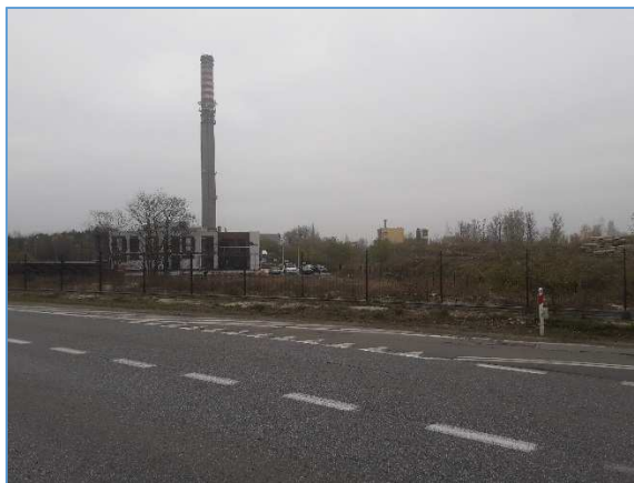
Fot. nr 2 Widok na południe – teren dawnych ZWCh "WISTOM"