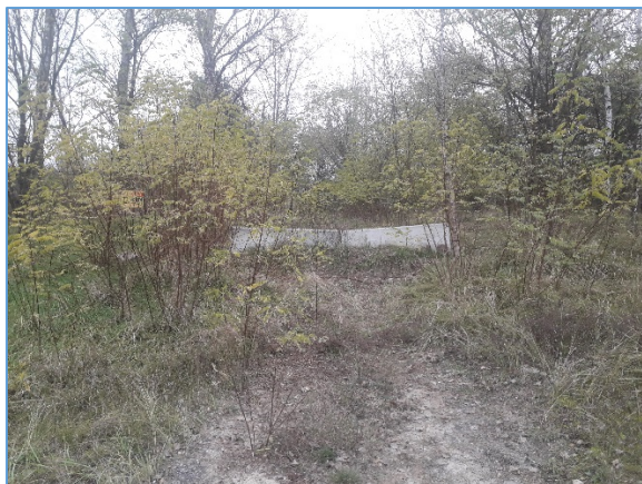
Fot. nr 1 Wjazd na składowisko