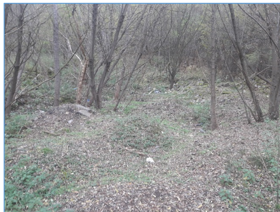
Fot. nr 4 Powierzchnia składowiska