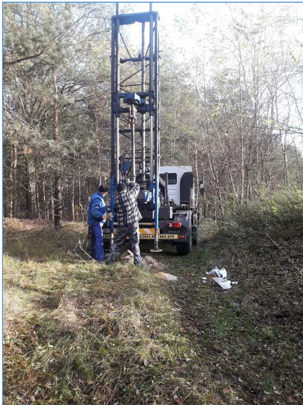
Fot. nr 7 Wiertnica UGB-50 – wiercenia otworów