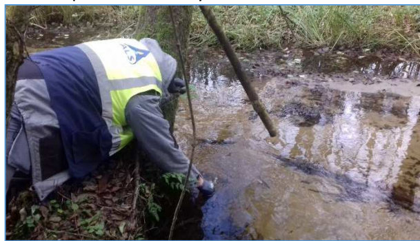
Fot. nr 15 Pobór próbki wód powierzchniowych