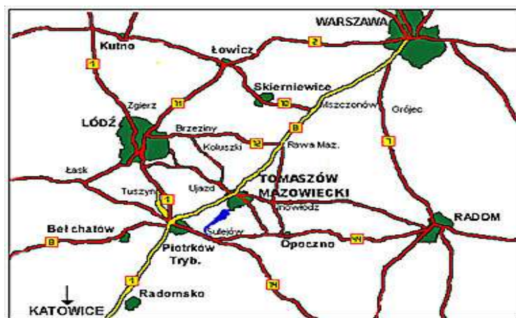
Rys. 3. Układ komunikacyjny w okolicy Tomaszowa Mazowieckiego

Tomaszów Mazowiecki jest istotnym węzłem komunikacyjnym. Przebiega tędy międzynarodowa droga E-67 łącząca Warszawę poprzez Wrocław z Pragą (droga krajowa nr 8), droga krajowa nr 48 Tomaszów Mazowiecki - Białobrzegi oraz droga wojewódzka numer 713 Łódź – Opoczno. Nie mniejsze znaczenie mają przebiegające tędy linie kolejowe Koluszki – Skarżysko Kamienna i Tomaszów Mazowiecki – Radom, mające bezpośrednie połączenie z Centralną Magistralą Kolejową.