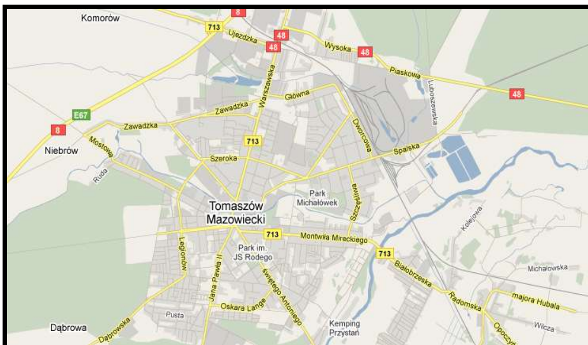
Rysunek 4 Układ komunikacyjny w mieście Tomaszów Mazowiecki

Obszar całego Powiatu tomaszowskiego charakteryzuje się jedną z najwyższych gęstości dróg w województwie łódzkim ale jednocześnie drogi w samym Tomaszowie Mazowieckim są słabej jakości, co dotyczy zarówno dróg wojewódzkich i powiatowych przebiegających przez Miasta, jak i samych dróg miejskich – lokalnych. Tomaszów Mazowiecki jest jednym z kluczowych punktów komunikacyjnych w województwie łódzkim, gdzie krzyżują się drogi międzynarodowa z krajową oraz drogi wojewódzkie. Przy tym Miasto nie posiada obwodnicy zewnętrznej, po której mógłby odbywać się ruch tranzytowy, a tak zwana „obwodnica wewnętrzna” przebiega po drogach powiatowych i miejskich, co powoduje ich ciągłą degradację. Ponadto taka charakterystyka ruchu samochodowego w Mieście wpływa na wzrost zanieczyszczenia powietrza oraz spadek bezpieczeństwa mieszkańców.