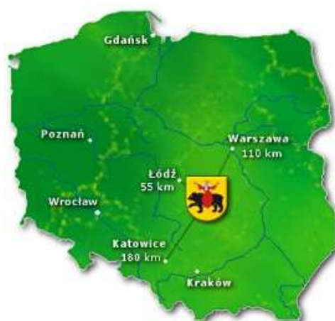
Rys. 1. Położenie Tomaszowa Mazowieckiego na mapie Polski

Tomaszów Mazowiecki to gmina miejska położona u ujścia rzeki Wolbórki do Pilicy, na Równinie Piotrkowskiej, sąsiadującej ze Wzgórzami Opoczyńskimi, a wchodzącej w skład Wzniesień Południowomazowieckich. Przez Miasto przepływa pięć rzek i rzeczek: Pilica, Wolbórka, Czarna - Bielina, Piasecznica i Lubochenka. Centralna część Miasta leży na wysokości 179 m n.p.m., natomiast najniższej położona jest Brzustówka - Nowy Port 153 m n.p.m. Położenie geograficzne miasta wyznaczają współrzędne 20°01' długości geograficznej wschodniej i 51°31' szerokości geograficznej północnej.