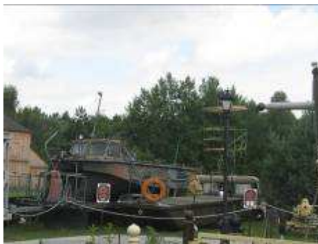
Skansen Rzeki Pilicy

Najbardziej rozbudowana jest ekspozycja zatytułowana „Młynarstwo wodne w dorzeczu Pilicy”. Najważniejszym jej elementem jest drewniany młyn wodny, przeniesiony wraz z całym wyposażeniem w latach 1998-2000 ze wsi Kuźnica Żerechowska, położonej nad rzeką Luciążą – największym lewym dopływem Pilicy. Wnętrze budynku zajmuje ekspozycja poświęcona tradycjom młynarstwa wodnego w dorzeczu Pilicy, w tym makiety młynów wodnych oraz mostów i parowca „Pilica” (wykonane przez Jerzego Sosnowskiego) oraz ruchome modele młynów różnego typu: wodnego, pływającego, frontowego, wiatrakokoźlaka oraz średniowiecznego młyna kieratowego (wykonane przez Jana Ekiela). Obok skansenowego młyna zostało zgromadzonych ponad 30 kamieni młyńskich pochodzących z nieistniejących już młynów z dorzecza Pilicy. Jest to największa tego typu kolekcja w Polsce.