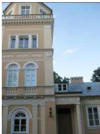
Muzeum im. Antoniego hr. Ostrowskiego

W Tomaszowie Mazowieckim działa Muzeum im. Antoniego hr. Ostrowskiego (ul. POW 11/15). Muzeum powstało w 1927 roku z inicjatywy prof. Tadeusza Seweryna i grupy osób zrzeszonych w Polskim Towarzystwie Krajoznawczym. Początkowo zbiory zgromadzono w Seminarium Nauczycielskim przy ul. Św. Antoniego, następnie w pierwszym lokalu przy ul. Mościckiego, od 1950 w obecnym miejscu – tj. w pałacu z 1812 roku należącym do rodziny Ostrowskich. Od 2000 roku Muzeum jest samorządową instytucją kultury o charakterze naukowo-badawczym, wystawienniczym i edukacyjnym.